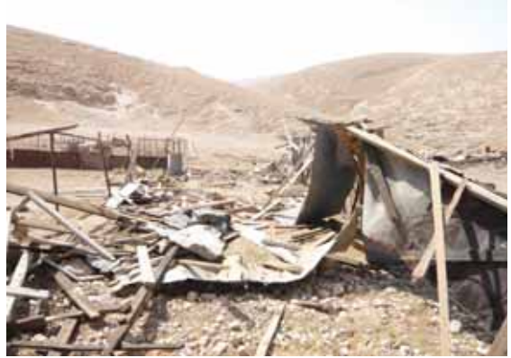
מכנים שנהרסו ע"י צה"ל באזור מוערביאית ב-9 בספטמבר.

2008. מהדוח עולה כי ממשלת ישראל נקטה במהלך פרק זמן זה ביותר צעדים המיועדים להקל על תנועת הפלסטינים בתוך שטחי הגדה המערבית, משנקטה במהלך תקופת הדיווח הקודמת. יחד עם זאת, ולמרות שמדובר בצעדים חיוביים ומבורכים, מהסקר עולה כי המערכת הכוללת של הגבלות התנועה הולכת ומתקבעת בשטח והופכת לעובדה מוגמרת. מספר המכשולים הכולל ברחבי הגדה המערבית הגיע ל-630 – עליה בשיעור של 3.3% ביחס לנתון שדווח בסוף תקופת הדיווח הקודמת. מן הסקר עולה גם כי כמעט שלושה רבעים מהנתיבים הראשיים המובילים אל 18 הערים והעיירות הפלסטיניות המאוכלסות ביותר בגדה המערבית חסומים או נשלטים באמצעות מחסום של צה"ל. כמעט מחצית מהנתיבים המשניים המובילים לאזורים אלו, אשר הוקמו במשך הזמן כחלופה לנתיבים הראשיים, חסומים גם הם או נשלטים באמצעות מחסום. (ניתן לעיין בדוח באתר האינטרנט של OCHA: www.ochaopt.org).