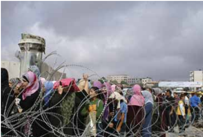
מתפללים פלסטינים מנסים להגיע לירושלים לתפילות יום השישי במהלך חודש הרמדאן

במהלך חודש הרמדאן השנה (1 - 29 בספטמבר) חל שיפור בניהול משטר היתרי הכניסה של מתפללים פלסטינים אשר ביקשו להתפלל במסגד אל אקצה שבירושלים, והדבר הוביל להורדת מפלס האלימות ולכך שיותר פלסטינים הורשו להשתתף בתפילות אלה, בהשוואה לשנים קודמות. עם זאת, גם השנה נמנעה הגישה של יותר מ-60% מהאוכלוסייה הפלסטינית שבקשה להתפלל במסגדים שבירושלים. הגישה של פלסטינים תושבי רצועת עזה נמנעה כליל וזו של בעלי תעודות זהות מהגדה המערבית הותרה כאמור באורח סלקטיבי כאמצעות משטר מיוחד של היתרים, המבוסס על גיל. משטר היתרים זה היה תקף למשך ארבעת ימי השישי של חודש הרמדאן.